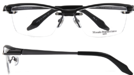
② Matt Black・Gunmetal/Gunmetal ② マットブラック・ガンメタル/ガンメタル