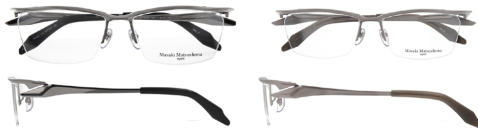
① Grey・Black ① グレー・ブラック

57□16-144 [B:34.5] Titanium, β-Titanium / Titanium 57□16-144 [B:34.5] チタン・βチタン / チタン