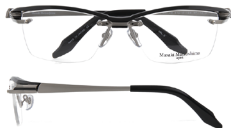
③ Black・Hairline Grey/Hairline Grey ③ ブラック・ヘアライングレー/ヘアライングレー