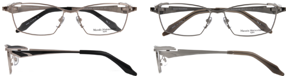
① Hairline Champagne・Black ① ヘアラインシャンパン・ブラック

58□15-141 [B:35.8] Titanium / Titanium, β-Titanium 58□15-141 [B:35.8] チタン / チタン・βチタン