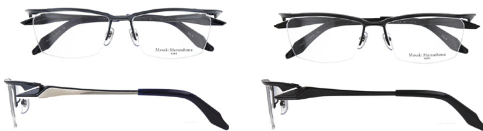
③ Navy・Silver ③ ネイビー・シルバー