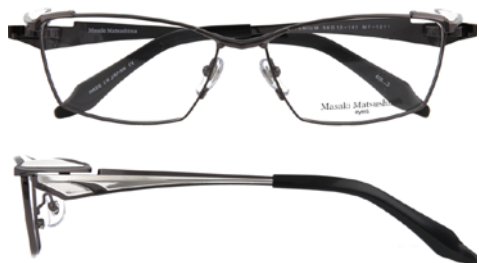
③ Gunmetal・Silver ③ ガンメタル・シルバー