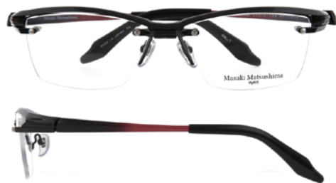
① Red Brown・Black/Red・Black Gradation ① レッドブラウン・ブラック/レッド・ブラックグラデーション